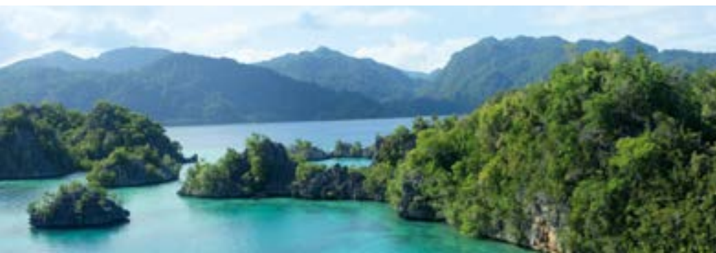
Sombori-Insel südöstlich vor Sulawesi

Ihre prächtigen Federn waren in der Modewelt lange Zeit begehrt: Die Paradiesvögel kommen nur auf Neuguinea und benachbarten Inseln vor. Dort leben auch Beuteltiere wie Baumkängurus, eierlegende Säugetiere, Warane oder die flugunfähigen Kasuare, die an Australien erinnern: Einst waren die Aru-Inseln und Neuguinea mit dem australischen Kontinent verbunden. Manche Art ist nur in einem begrenzten Ökosystem, einem isolierten Gebiet oder auf einer einzigen einsamen Insel endemisch – ein Zeichen, dass sich Arten in erdgeschichtlich kurzer Zeit verändern können. Die Inselwelten Indonesiens sind in ihrer Artenvielfalt einzigartig – und brauchen unseren Schutz.