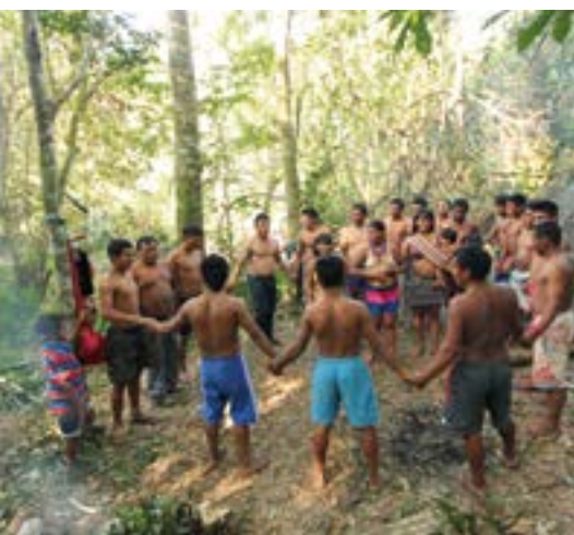
Zeremonie zum Schutz des Waldes