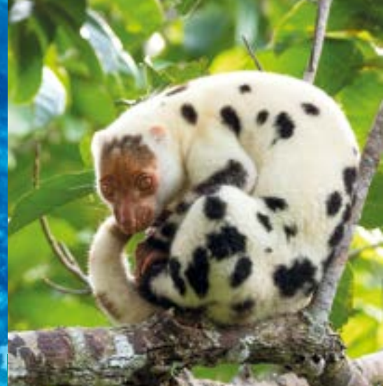
Der Tüpfelkuskus bewohnt die Aru-Inseln und Neuguinea

reise durch den Archipel erkannt, dass die Evolution in der Isolation überall eigene Wege geht. Jede Insel hat ihre besondere Geschichte und ihren besonderen Charakter im Mosaik der Biodiversität.