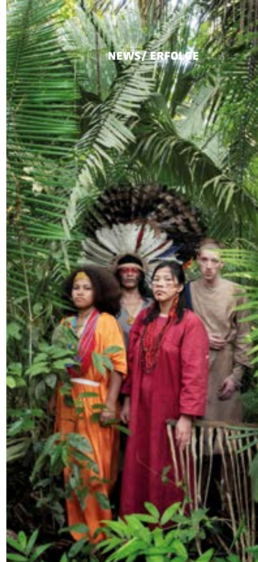
Szene aus dem Theaterstück „Antigone im Amazonas“

Es geht um den brasilianischen Palmölkonzern Agropalma, der auf drastische Weise zeigt, wie das System der Zerstörung, Entrechtung und Ausbeutung funktioniert. Agropalma ist mit zehn internationalen Siegeln zertifiziert. An unserer Petition gegen den Etikettenschwindel bei Agropalma haben bereits über 75.000 Menschen teilgenommen.