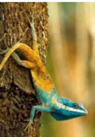
Blaukopf-Schönechse in Kambodscha