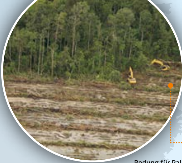
Rodung für Palmöl/Borneo

Während der letzten Jahrzehnte wurden die Regenwälder immer mehr gerodet und zerstückelt: Für die Papierherstellung, Agrarplantagen, Holzindustrie und Bergbau (S. 11).