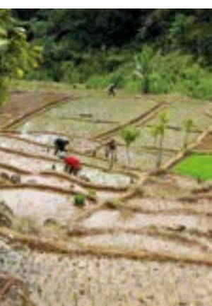
Reisanbau im Gemeindewald