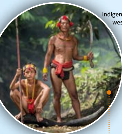
Indigene auf der Insel Siberut, westlich vor Sumatra

Die ersten Menschen (homo sapiens) besiedelten vor etwa 65.000 Jahren die südostasiatische Region – vor allem den heutigen indigenen Völkern verdanken wir die Bewahrung einzigartiger Naturschätze.